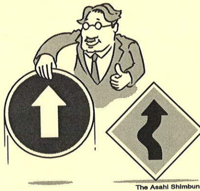
The Asahi Shimbun

志望した大企業の採用試験にすべて落ちてしまいました。留年して来年の就活に賭けた方が良いでしょうか？